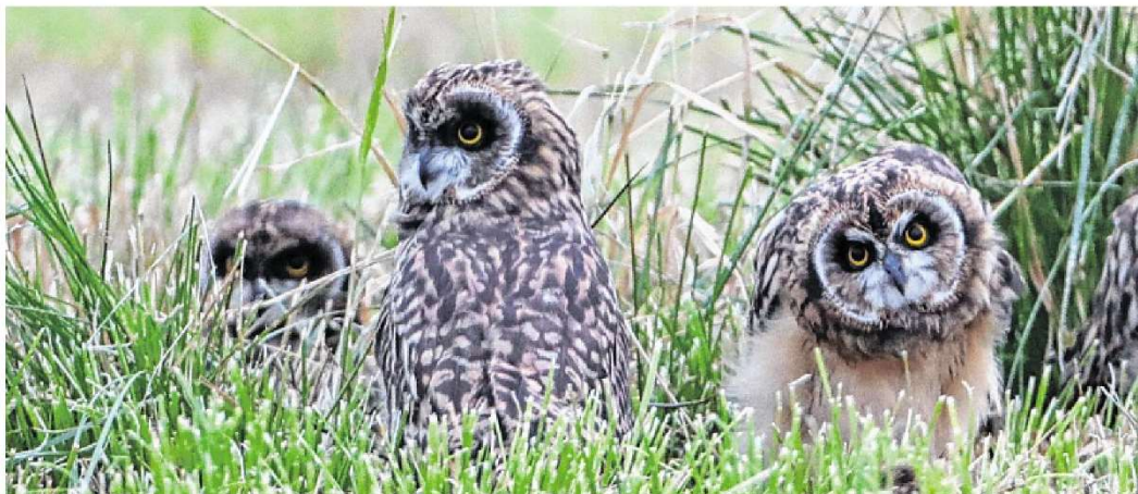
Diese Eulen haben es geschafft. Sie sind flügge geworden, bevor die Wiese gemäht wurde, in der sich ihr Nest befand.